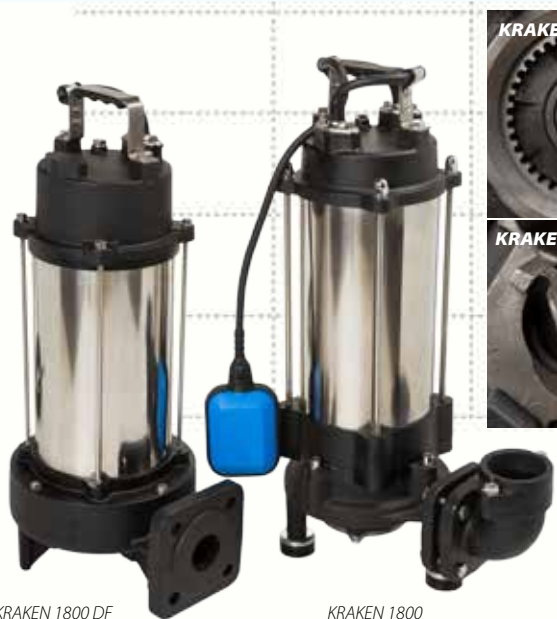
KRAKEN 1800 DF